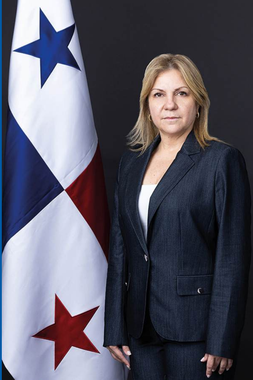
Su Excelencia Dinoska Montalvo Ministra de Gobierno