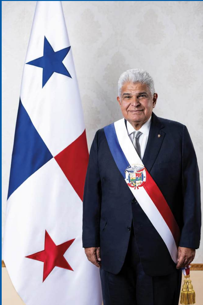
Excelentísimo Señor José Raúl Mulino Presidente de la República de Panamá