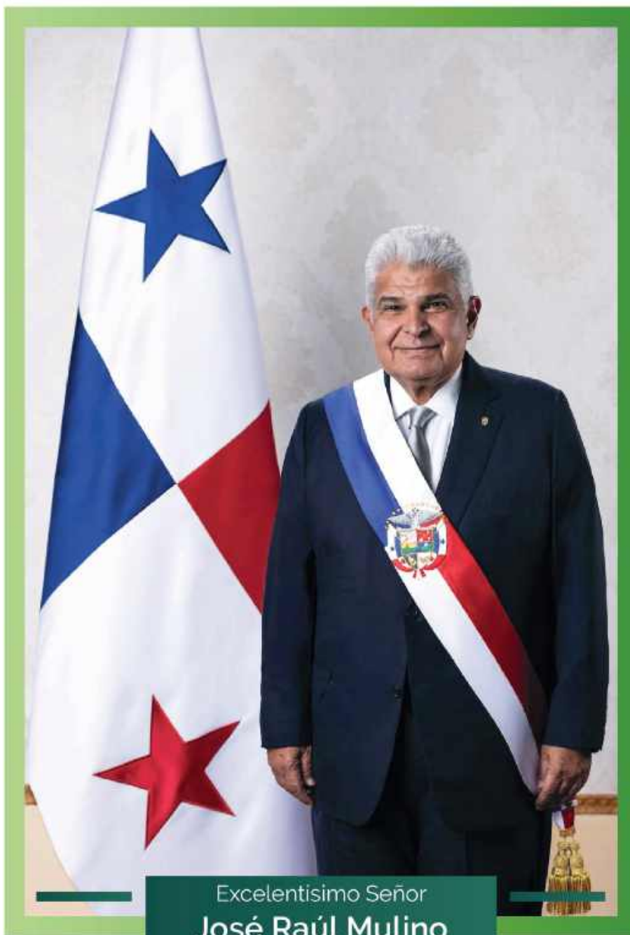
Excelentísimo Señor José Raúl Mulino Presidente de la República de Panamá