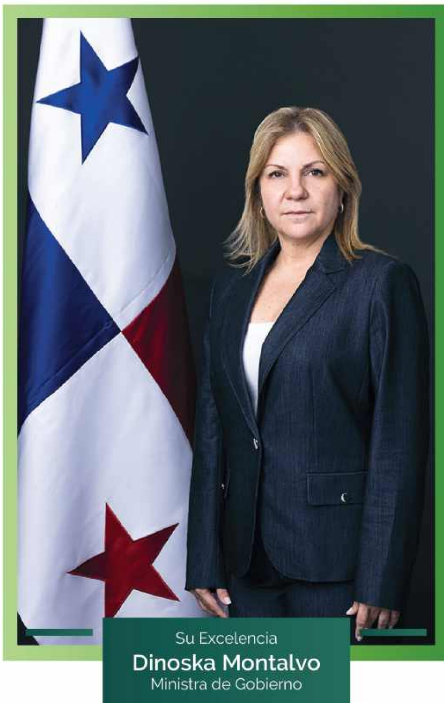
Su Excelencia Dinoska Montalvo Ministra de Gobierno